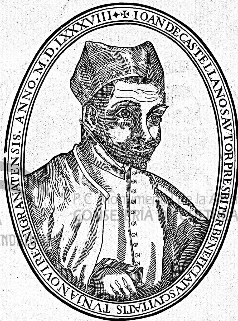
JUAN DE CASTELLANOS